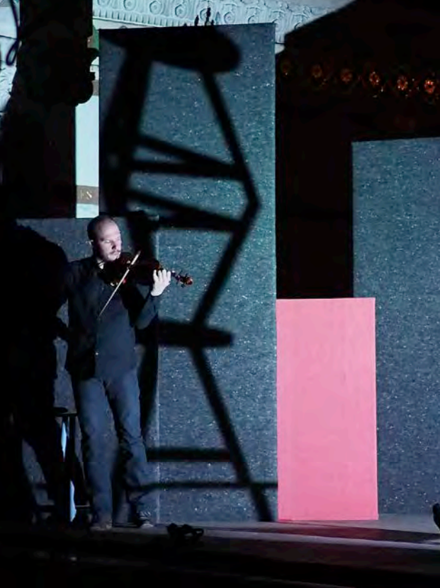
9 avril 2022, Basilique de Fourvière, Lyon