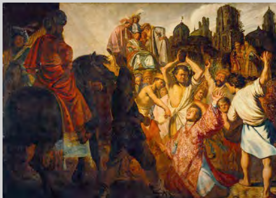
La Lapidation de Saint Étienne, Rembrandt, 1625, Musée des Beaux-Arts de Lyon

Coproduction Dominoprod (42) Telli Sabata, association culturelle, Charnay (69)