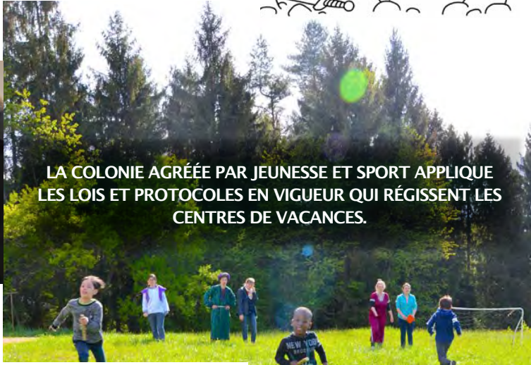
LA COLONIE AGRÉÉE PAR JEUNESSE ET SPORT APPLIQUE LES LOIS ET PROTOCOLES EN VIGUEUR QUI RÉGISSENT LES CENTRES DE VACANCES.