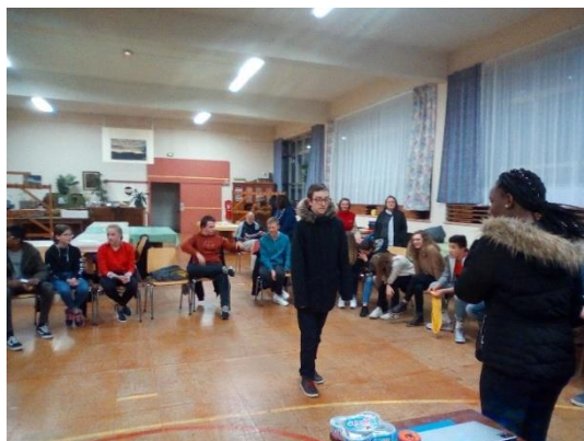
Images de la retraite vécue avec l'ensemble des jeunes de Colmar

l'ensemble des jeunes de toutes les paroisses ont participé à une recollection, les 4 et 5 mai aux Trois Epis. Ce fut un temps fort de rencontres, de réflexions et de prières. Venons nombreux ce samedi 8 juin pour accompagner ces jeunes et les encourager à vivre pleinement leur vie de jeunes chrétiens.